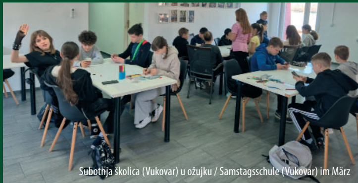
Subotnja školica (Vukovar) u ožujku / Samstagsschule (Vukovar) im März

U subotu, 14. ožujka uspješno je započeo ovogodišnji ciklus Subotnje škole u Vukovaru, namijenjen djeci osnovnoškolskog uzrasta. Odaziv je bio iznimno velik i više nego zadovoljavajući.