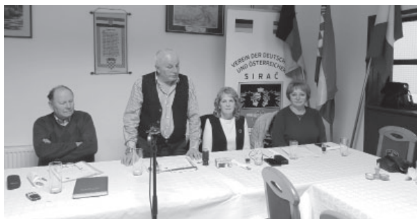
Skupština u Siraču / Versammlung in Sirač

Članovi Udruge su usvojili izvješća o radu i financijama za proteklu godinu.