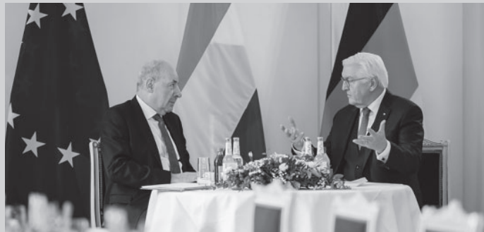
Susret mađarskog i njemačkog predsjednika u Münchenu / Treffen der ungarischen und deutschen Präsidenten in München

deutsche nazistische Regierung im Zweiten Weltkrieg im Gebiet von Osteuropa verübte, unterstützt vom Beschluss der westlichen Alliierten bei der Konferenz in Potsdam im Sommer 1945, die Flucht und Vertreibung von mindestens 12 Millionen ethnischer Deutschen aus den osteuropäischen Ländern zur Folge hatten.