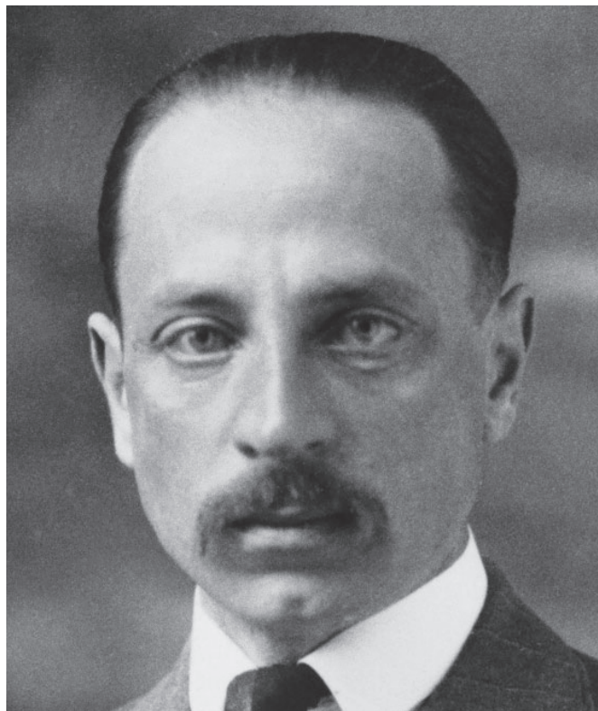
Reiner Maria Rilke

Paul Hindemith (Hanau, 16. studenog 1895. – Frankfurt na Majni, 28. prosinca 1963.), djelovao je kao vrlo plodan skladatelj, dirigent, solistički i komorni virtuoz na violini i violi te kao pedagog. Jedan je od pionira europske glazbene moderne. Od 1927. do 1935. predavao je kompoziciju na Berlinskoj visokoj školi za glazbu (Hochschule der Künste Berlin). Došao je u sukob s nacističkom vlašću - njegova djela su bila zabranjena za emitiranje na njemačkom radiju i suspendiran je s mjesta profesora na berlinskom sveučilištu uz etiketu „da njegova djela stvaraju atonalnu buku“. Bio je prisiljen napustiti Njemačku i otišao je u Tursku, gdje je u Ankari (od 1935. do 1937.) mnogo pridonio organiziranju i podizanju tamošnjeg glazbenog života i rada tamošnjeg Konzervatorija. Godine 1938. bio je ocrnjen na izložbi „Degenerirana glazba“ (Entartete Musik) u Düsseldorfu, gdje je istaknuto i židovsko podrijetlo njegove supruge kako bi ga se diskreditiralo. Preselio se 1939. u Švicarsku, a 1940. u Sjedinjene Američke Države, gdje je predavao kompoziciju u Bostonu, pa na Sveučilištu Yale u New Havenu. Postao je američki državljanin 1946. godine, a od konca 1940-ih djelovao je kao dirigent brojnih orkestrara,