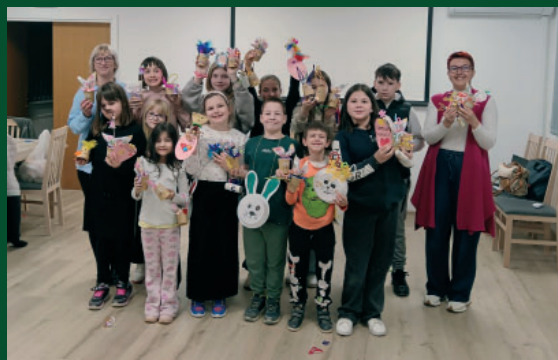
Uskrsna radionica u Siraču / Osterworkshop in Sirač