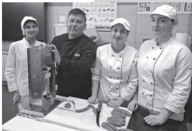
Pravljenje kobasica po njemačkom receptu / Wurstherstellung nach deutschem Rezept

Razdoblje zajedničke povijesti tijekom Habsburške