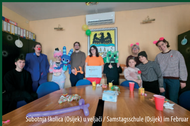
Subotnja školica (Osijek) u veljači / Samstagsschule (Osijek) im Februar