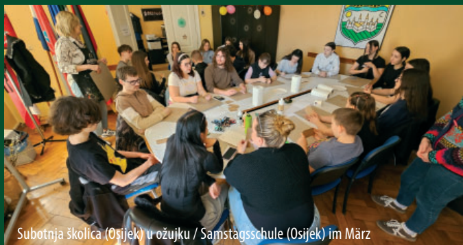
Subotnja školica (Osijek) u ožujku / Samstagsschule (Osijek) im März