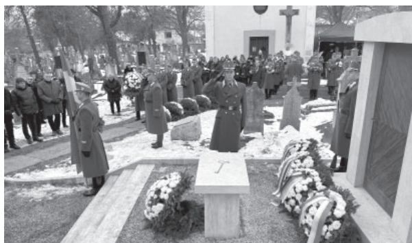
Vijenci na spomeniku raseljenim mađarskim Nijemcima na groblju Wudersch u Budaörsu / Kränze am Denkmal für vertriebene ungarische Deutsche auf dem Friedhof Wudersch in Budaörs

Istoga dana komemoracija je održana i u Budimpešti. U četvrti Budaörs, s čije je željezničke stanice 19. siječnja 1946. krenuo prvi deportacijski vlak prema Njemačkoj, održan je skup u organizaciji Njemačke nacionalne samouprave u Mađarskoj i Vlade Savezne Republike Njemačke. Skupu su, među ostalima, nazočili najviši predstavnici njemačke nacionalne manjine u Mađarskoj, László Kövér, predsjednik mađarskoga parlamenta, Olivia Schubert, predsjednica Europske federalističke unije nacionalnosti (FUEN), Julia Katharina Gross, veleposlanica SR Njemačke u Mađarskoj te brojni drugi uglednici.