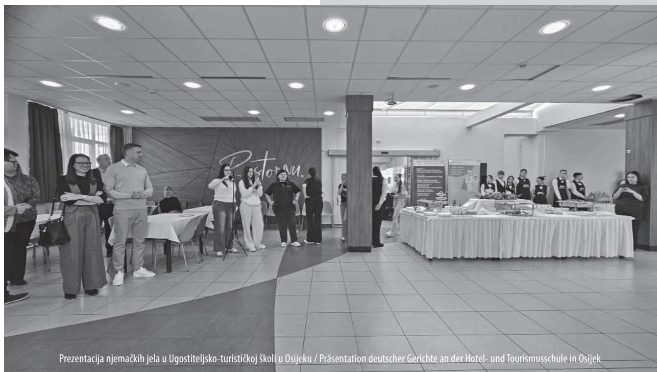
Prezentacija njemačkih jela u Ugostiteljsko-turističkoj školi u Osijeku / Präsentation deutscher Gerichte an der Hotel- und Tourismusschule in Osijek